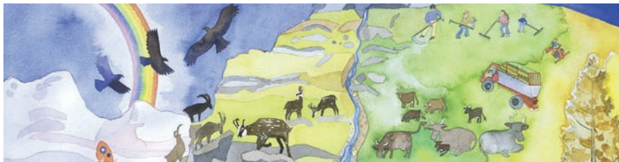
Fotos: Erwin Kirsch (& fotolia) Illustration: Archiv Stoffel Karte: Quelle: parcadula.ch

Tritt man dem Nationalparkprojekt nicht bei, heißt das ja nicht, dass wir Bauern nicht auch die gleichen Ziele anvisieren. Wir sind dann autonom Handelnde und binden uns nicht an einen Vertrag. Wir bleiben mündig. Geben wir unser Erbe nicht in andere Hände und verwalten es zusammen mit der Gesellschaft in aller Interesse. Was die Naturschutz-Elite um den IUCN vorgibt wissenschaftlich zu sein, ist nicht weise, wenn man sieht was ihre Planungen an Zerstörung anrichten.